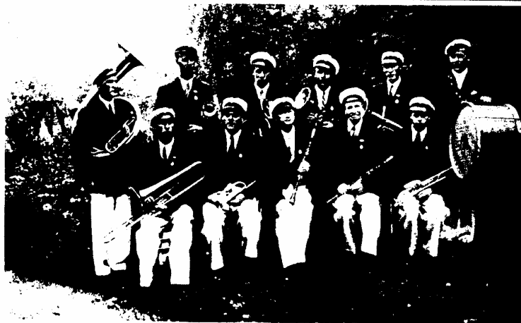
MYKLEBY OG RASTA HORNMUSIKKORPS