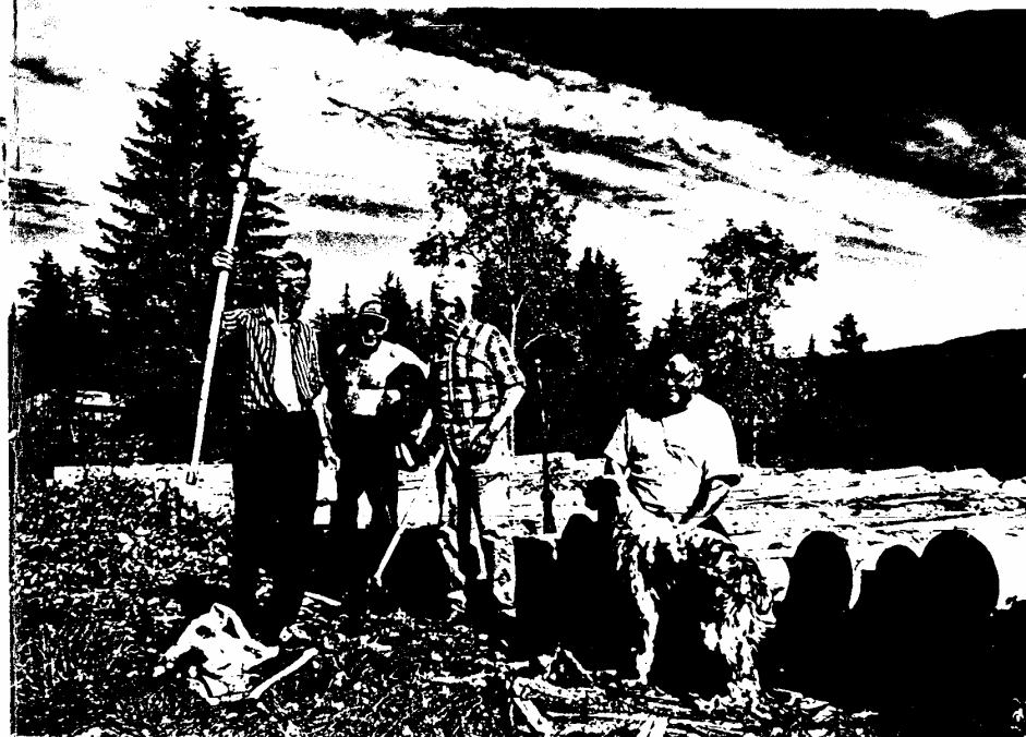
"Arbeidslaget hass i iggo!"